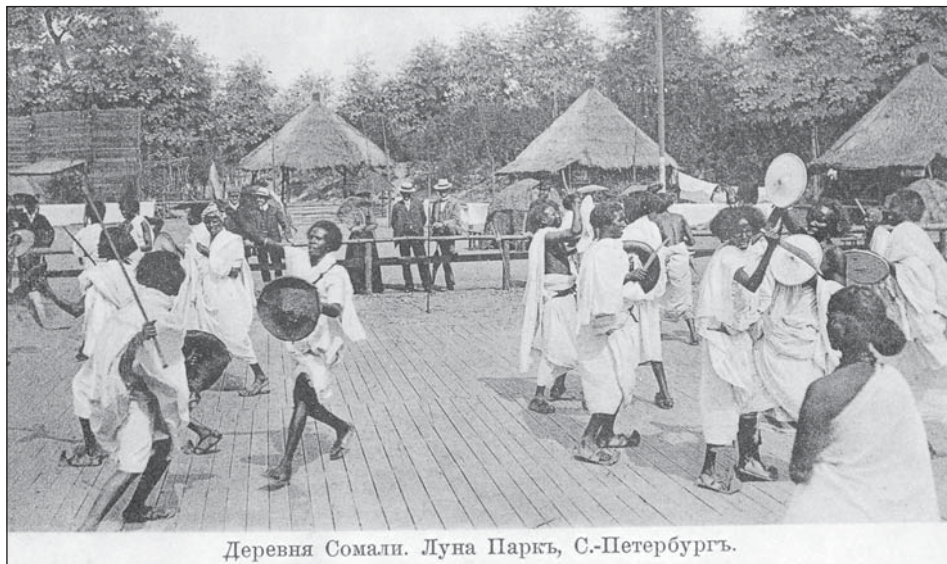
Деревня Сомали. Луна Паркъ, С.-Петербургъ.

Так, на сцене нового театра, открытого при Луна-парке после того, как Ялышев продал «Крестовский остров» и находившийся при нем маленький театр, в декабре 1913 г. был показан футуристический спектакль по пьесе Маяковского. Спектакль, правда, провалился, актеры и автор пьесы вынуждены были спешно покинуть сцену. Помимо театра при Луна-парке работали театр оперетты, мюзик-холл, варьете и целых два кинотеатра — «Дона Глория» и «Глория».