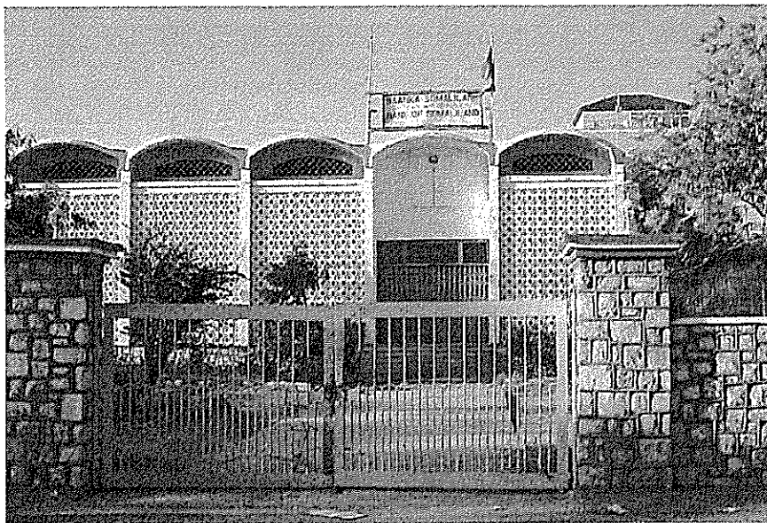
Банк Сомалиленда в Харгейсе.

сколько ему нужно для покрытия собственных текущих расходов.